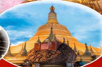
พระธาตุมุเตา

สักการะ 9 สิ่งศักดิ์สิทธิ์ ที่ต้องห้ามพลาด