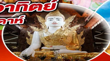
พระหงาทัดจี